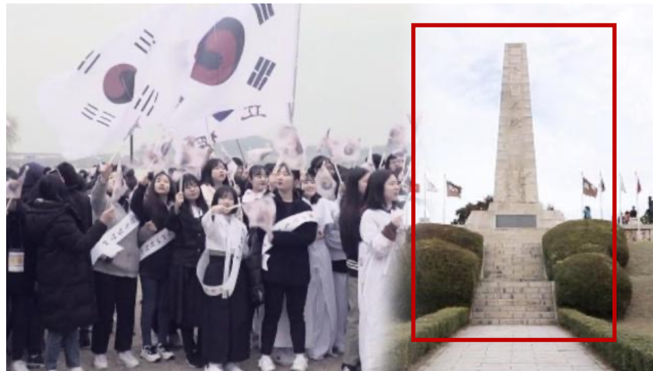
영상 속 인서트 컷 및 CG 합성 요소로 활용