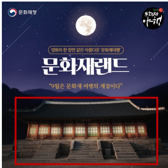
홍보 디자인 합성